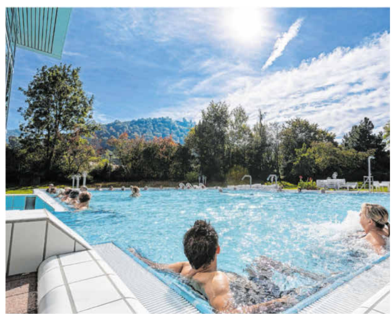
Badegäste entspannen sich in einem Becken der Vinzenz-Therme in Bad Ditzgenbach.

Unterhaltungsmusik am Donnerstag, 13. Februar, um 14.30 Uhr, evangelisches Gemeindehaus.