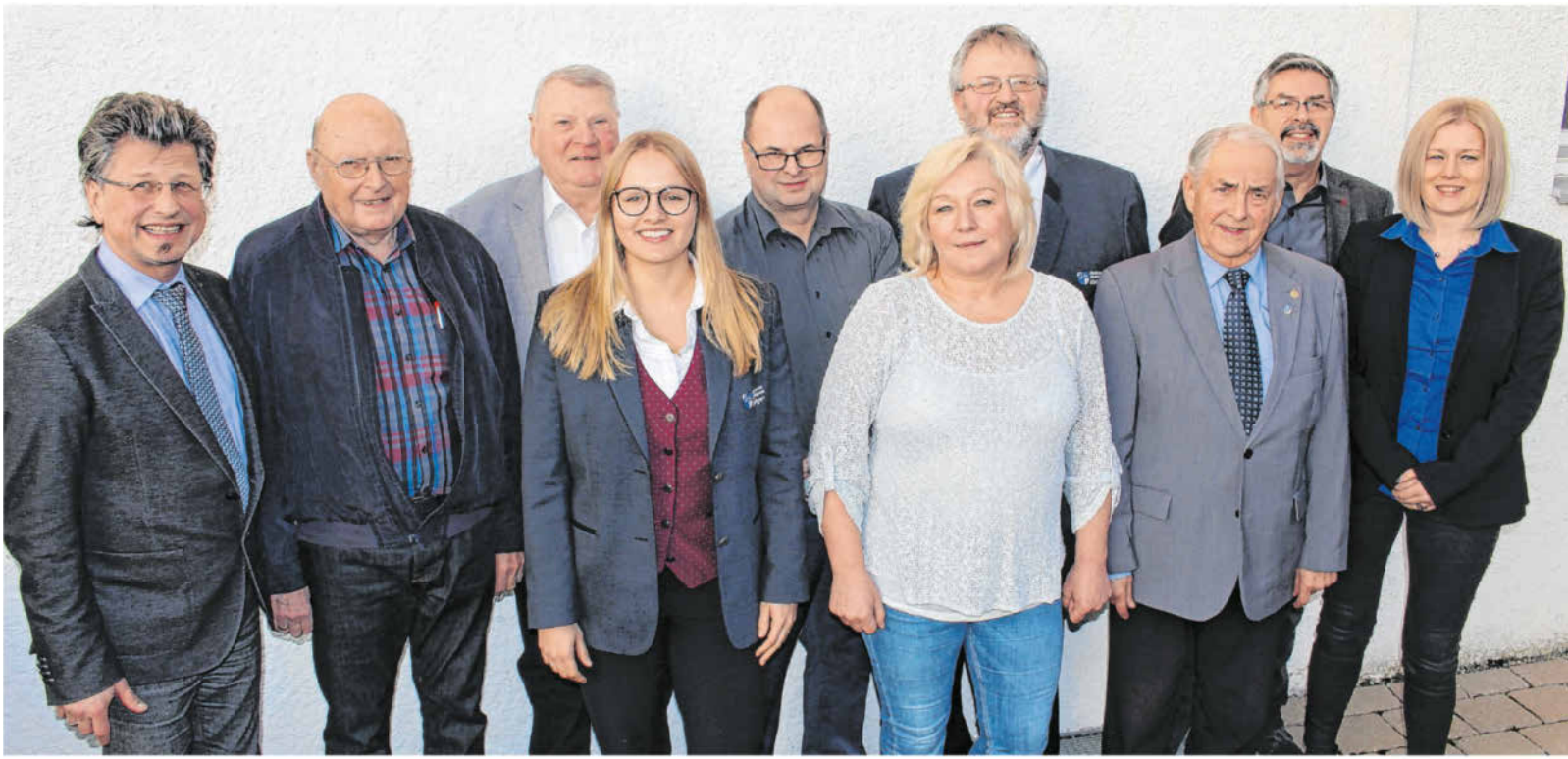
Ein neues Vorstandsteam lenkt künftig die Geschicke des Kreisverbandes.